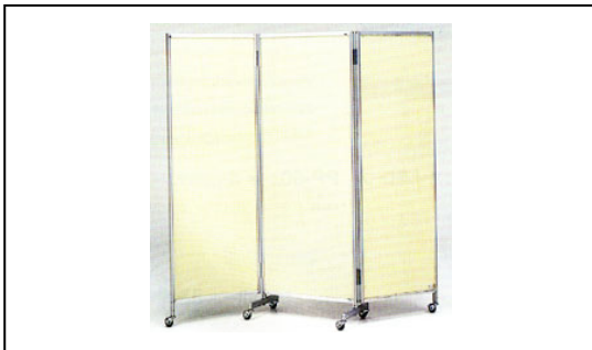
アイボリー・キャスター付

6 ハンガーラック ¥2,750-(税込) W950×D450×H950~1700